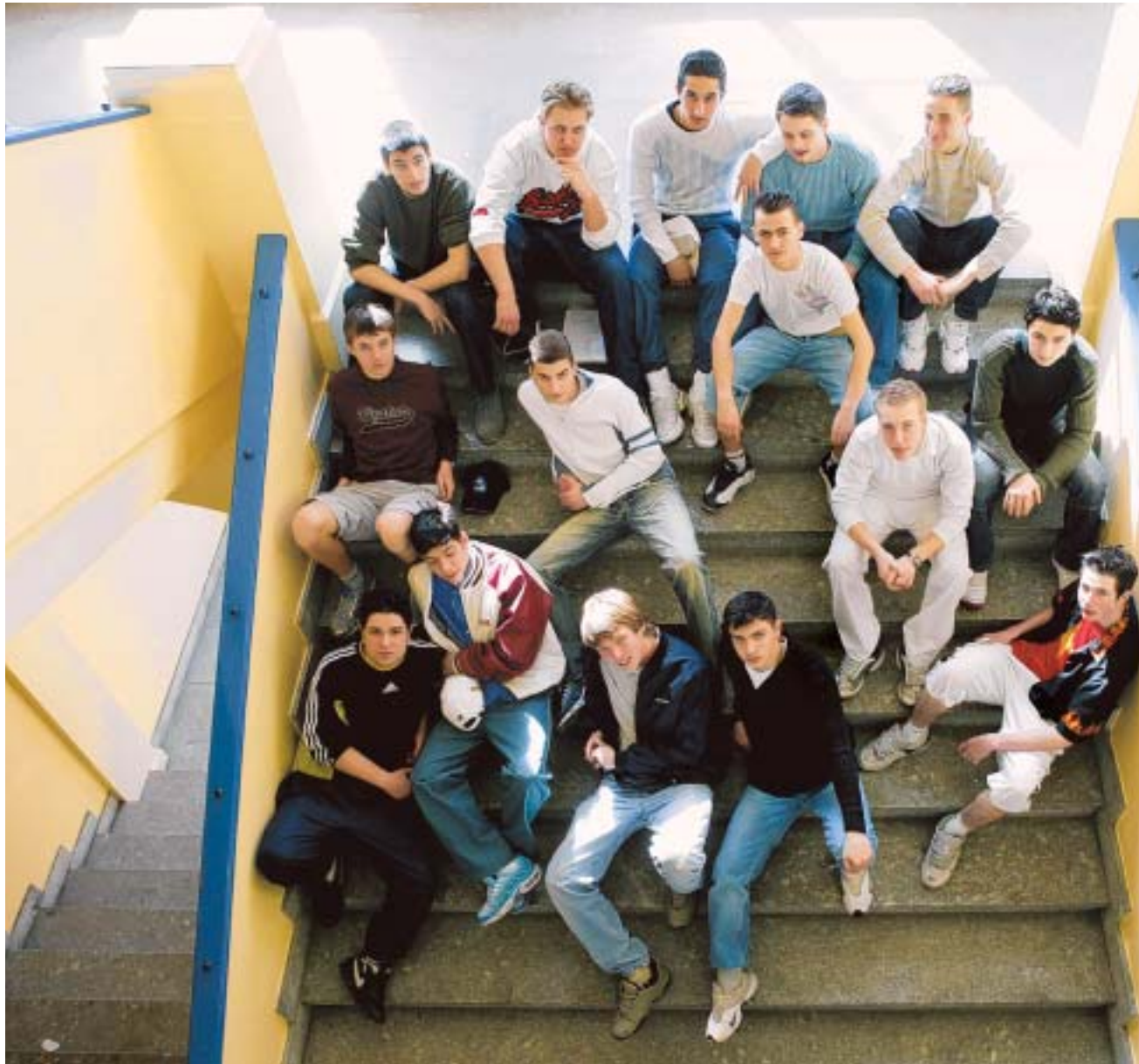
Traumberuf ade. Die Schüler der Klasse 10c des Claraschulhauses suchen intensiv nach einer Lehrstelle – für viele ein Frust: Selbst bei Berufen zweiter Wahl sind die meisten noch nicht fündig geworden.

Bald ist August, doch viele Basler Schüler sind noch immer auf der Suche nach einer Lehrstelle. Besonders schwierig ist es bei den Brückenangeboten im 10. Schuljahr, wie das Beispiel der Klasse 10c im Claraschulhaus zeigt: Erst vier von 18 Schülern haben eine Stelle gefunden.