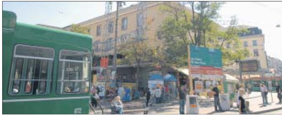
Bauen oder nicht? Die Pläne des neuen Stadtcasinos sorgen auch an Schulen für Gesprächsstoff.

sagen, was sie beschäftigt. Es wird jeweils eine andere Klasse berücksichtigt. Heute diskutieren Schüler der Vorlehre A. Das Ziel der Ausbildung: Junge, die keine Lehrstelle gefunden haben, erhalten Unterstützung. sk.